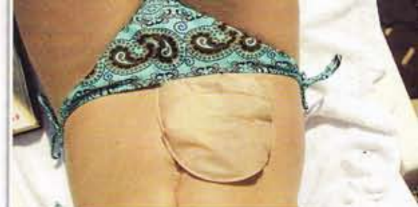
Camilla använder ett bandage med fästplatta som får sitta runt stomin ett par dagar innan den byts. Påsen byts varje morgon och töms sex till sju gånger per dag.

Läkarna förklarade att hennes tjocktarm inte gick att rädda. Stomin var lösningen som skulle